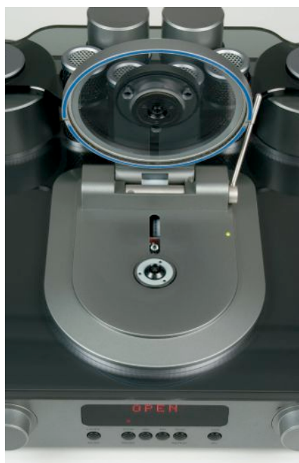
Hermetyczna pokrywa płyty chroni przed kurzem układ optyczny napędu.

Żeby się dostać do środka, trzeba odwrócić odtwarzacz do góry nogami i odkręcić kilka śrub mocujących dno. Po uporaniu się z nimi widok, jaki tam ujrzycie, nijak się nie kojarzy z urządzeniami lampowymi. Całe wnętrze zajmują cztery płytki drukowane, szczelnie wypełnione układami elektronicznymi. Nie ma płataniny