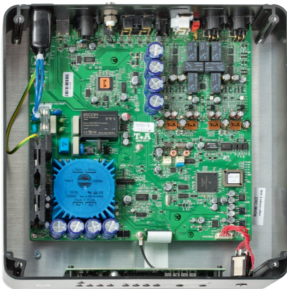
Całą elektronikę audio zintegrowano wraz z zasilaczem na jednej płytce.

Niewielki, plastikowy pilot przyda się zarówno do obsługi niekonwencjonalnych funkcji przetwornika, jak i do regulacji głośności.