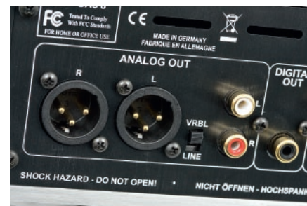
Wyjścia analogowe zarówno RCA, jak i XLR – w obydwu przypadkach z regulacją poziomu.

Popis dynamiki, energii i dokładności. Bezpośrednie, angażujące.