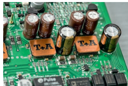
W każdym kanale pracują dwa przetworniki, chronione przez miedziane osłony z logo firmy. Miedziane ekrany zamontowano również na innych elementach toru cyfrowego.